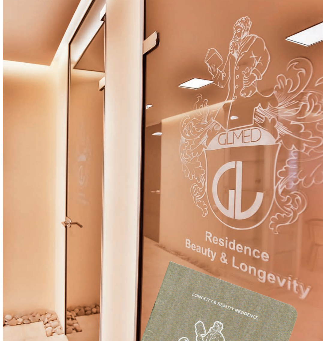
ПАСПОРТ ЗДОРОВЬЯ ПАЦИЕНТА РЕЗИДЕНЦИИ GLMED